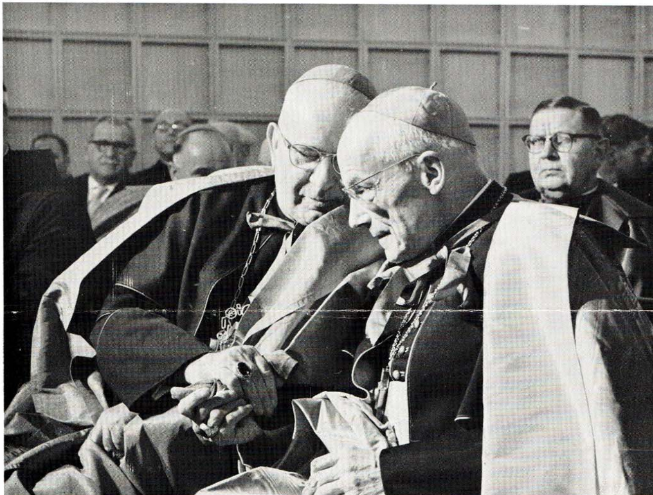
Der Erzbischof von Köln, Joseph Kardinal Frings, im Gespräch mit dem Bischof von Danzig, Carl Maria Splett, beim Festakt in Düsseldorf

VOM 23. BIS 25. AUGUST 1963 KAMEN DIE DANZIGER KATHOLIKEN AUS ANLASS DES SILBERNEN BISCHOF SJUBILÄUMS IHRES OBERHIRTEN SR. EXZELLENZ DR. CARLMARIA SPLETT, BISCHOF VON DANZIG, IN DER PATENSTADT DÜSSELDORF ZUSAMMEN. ES WAREN TAGE UNVERGESSLICHER BEGEGNUNG FÜR ALLE DANZIGER.